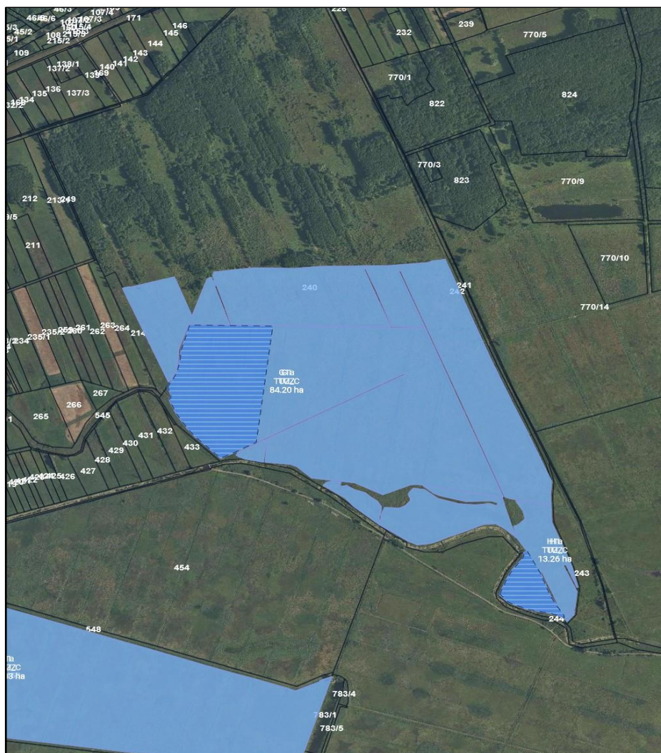
Mapka z lokalizacją skoszonego siana